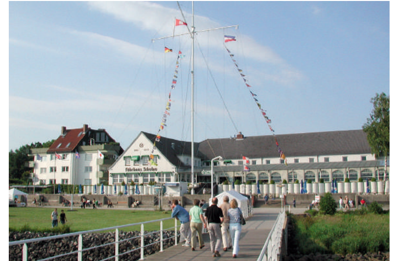
› Das Willkomm Höft: Täglich wird hier in der Zeit von 10 bis 18 Uhr jedes vorbeifahrende Schiff über 1.000 GT begrüßt.