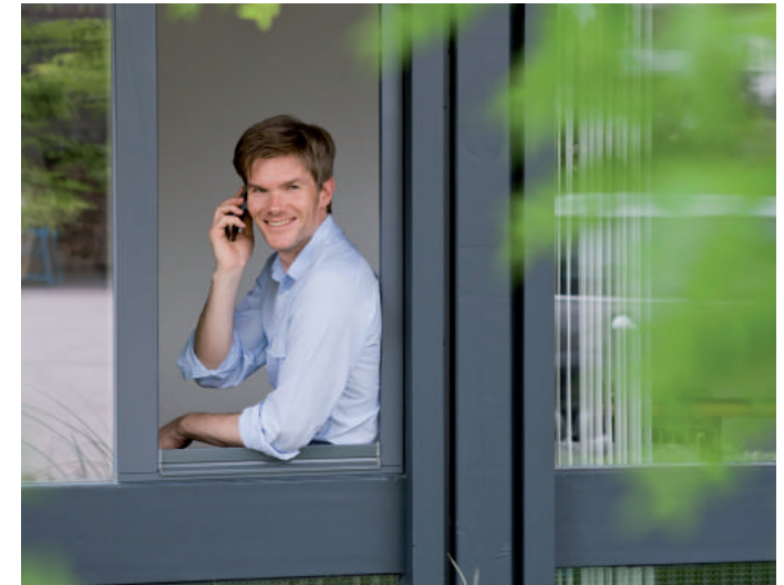
› Arbeiten im Grünen