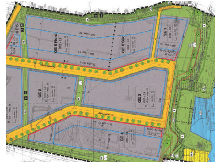
› Bebauungsplan des BusinessParks von oben

Auf dem traumhaften BusinessPark Elbufer Areal entwickeln gegenwärtig bereits erste Investoren ihre Projekte. Je früher Sie sich für eine Ansiedlung in bester Elblage entscheiden, desto besser können und werden wir Ihren Wünschen Rechnung tragen.