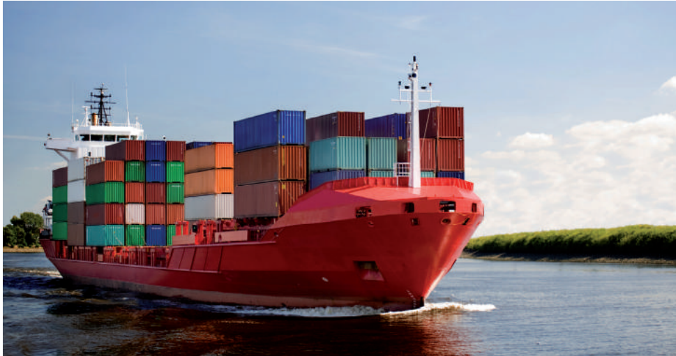
› Traumblick über die Elbe