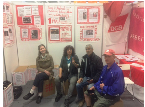
Stand auf dem Kirchentag in Berlin 2017

Die Arbeitslosenselbsthilfe – Arbeit für alle – e.V. Wedel beteiligte sich wieder auch am 37. Kirchentag in Dortmund mit einem Infostand auf dem Markt der Möglichkeiten im Bereich, Arbeit, Arbeitslosigkeit und Armut.