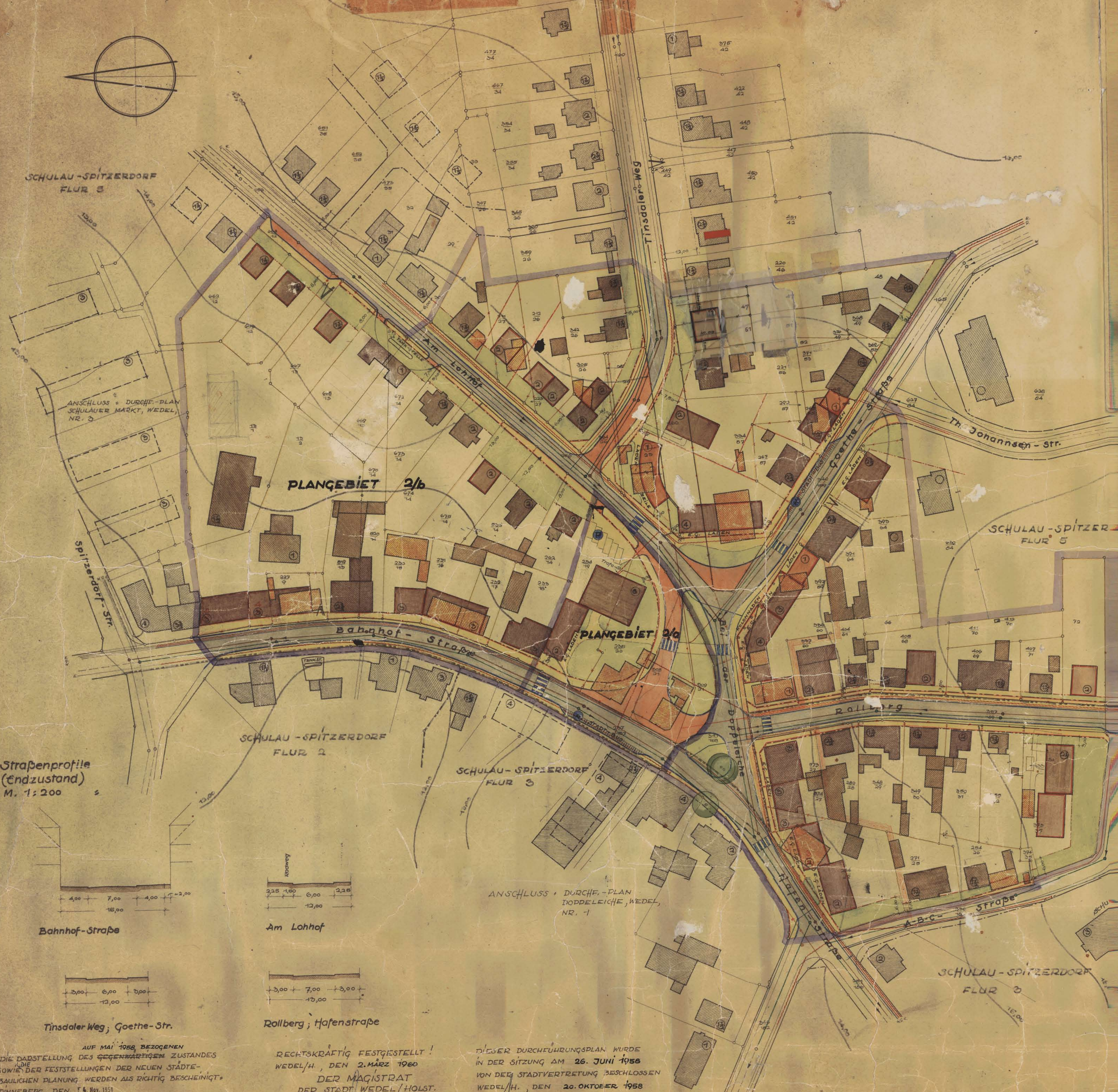
Strassenprofile (Endzustand) M. 1:200

GENEHMIGT GEM. VEREIN NR. 348 v. 27.10.1958 VOM 27.10.1958 KIEN. VEREIN für Arbeit, Kunst und Fortschritt des Landkreises Weidel/Holst. 1/4. Müller