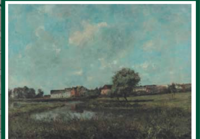
BLICK AUF DIE WASSERMÜHLE Standort: Auweidenweg