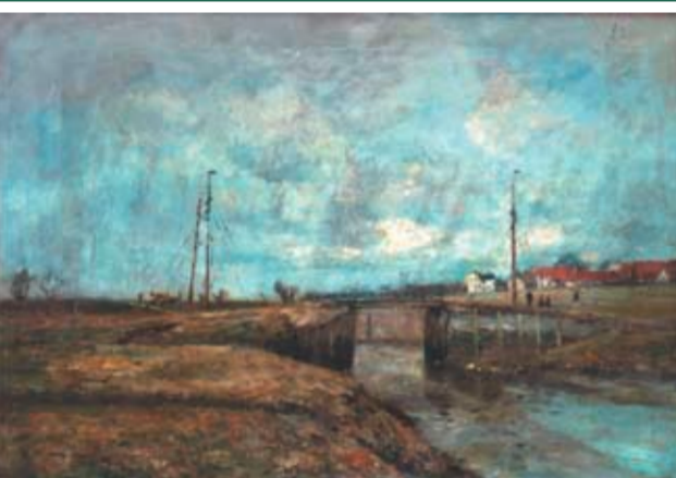
STOCKBRÜCKE Standort: Brooksdamm