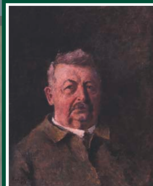
SELBSTPORTRAIT Standort: Mühlenstraße