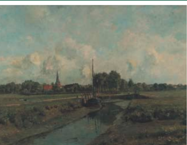
ALTER WEDELER HAFEN Standort: Schulauer Straße