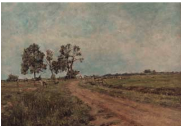
MARSCHWEG Standort: Saatlandsdamm