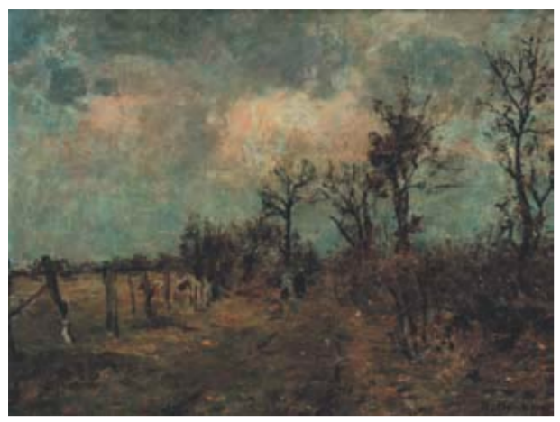
WEG NACH FÄHRMANSSAND Standort: Saatlandsdamm