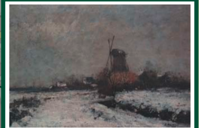
WEDELER MÜHLE Standort: An der Mühle