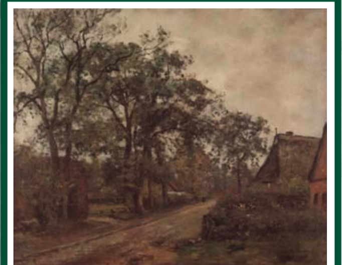
ALTE DORFSTRASSE Standort: An der Doppeleiche