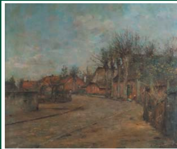
HINTER DER KIRCHE Standort: Pinneberger Straße / Hinter der Kirche