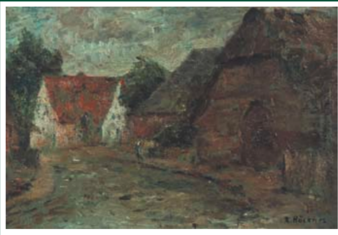
ANSGARIUSSTRASSE Standort: Rolandstraße