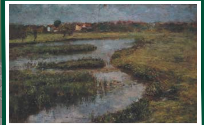
AUENLANDSCHAFT Standort: Auweidenweg