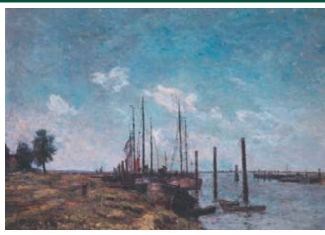
SCHULAUER HAFEN Standort: Strandweg